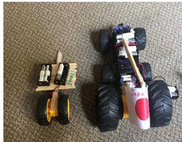
ロボティクスクラス