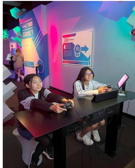
ポップカルチャー美術館