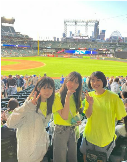
マリナーズ野球観戦