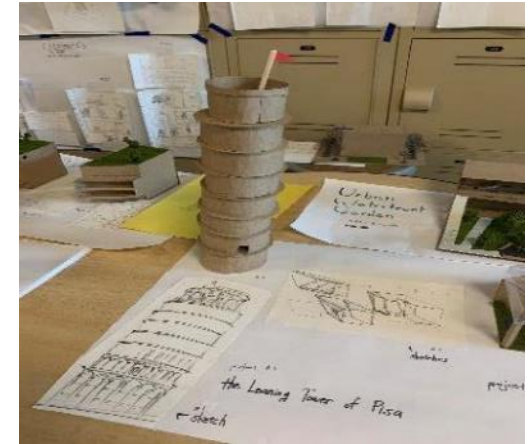
建築デザインクラス