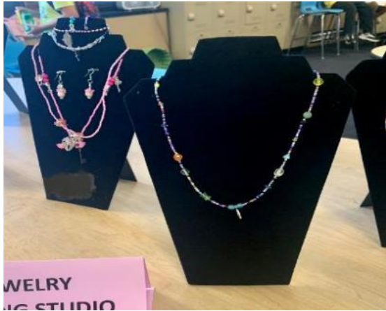
ジュエリー制作クラス