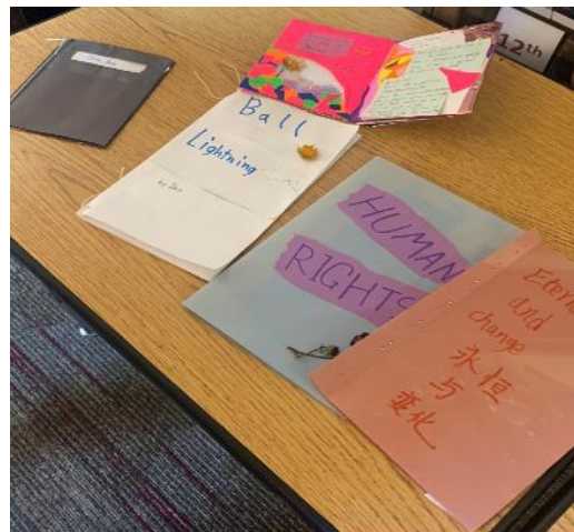
リーダーシップクラス