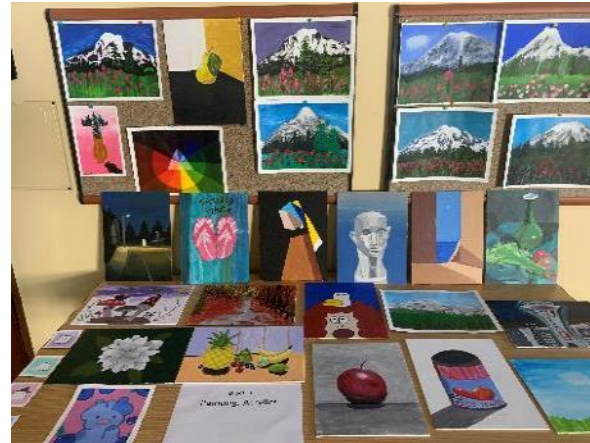
ペインティングクラス