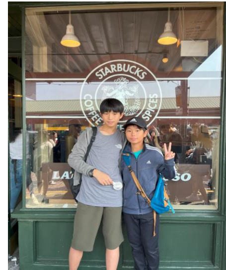
スターバックス1号店