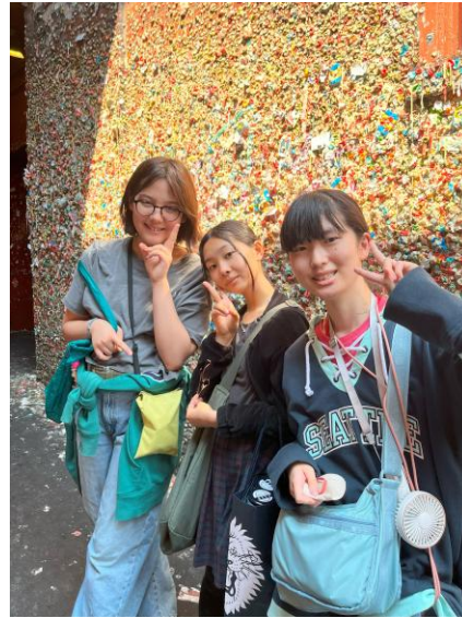
ダウンタウン観光