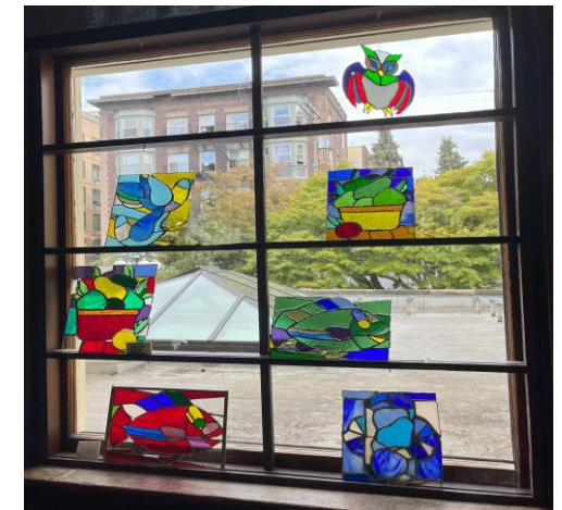
ステンドグラスクラス