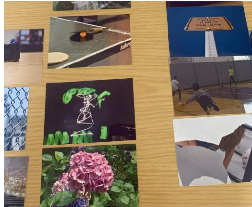
デジタル写真クラス