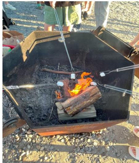
ビーチでマシュマロ焼き